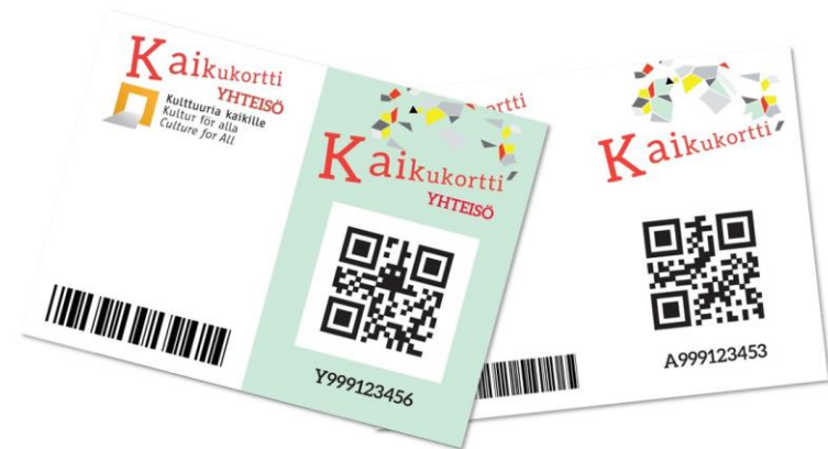
Kuva: esimerkki yhteisön ja asiakkaan Kaikukortista

Kaikukortilla voi hankkia maksuttomia pääsylippuja ja kurssipaikkoja kulttuuripalveluihin sekä joihinkin liikuntakohteisiin ja urheilutapahtumiin - maksuttomia pääsylippuja myös omille lapsille (alle 18v.) ja lapsenlapsille (alle 18v.)